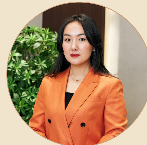
Г. Мөнхбилэг Ёс зүйн хорооны дарга ДБГ-ХЦНЗ Албаны дарга