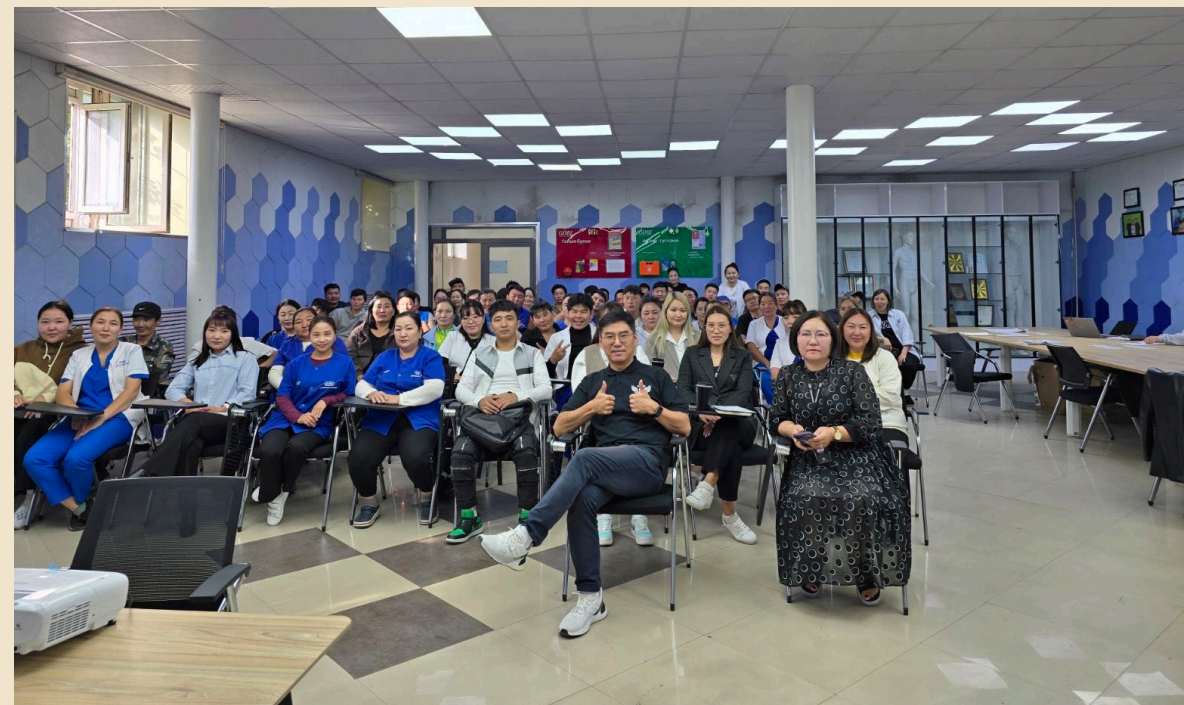
“Корпорейт Комплаенс Менежмент” ХХК-аас авсан зөвлөх үйлчилгээний хүрээнд “Ажлын байрны ёс зүй” сургалтад 145 ажилтныг хамруулав.