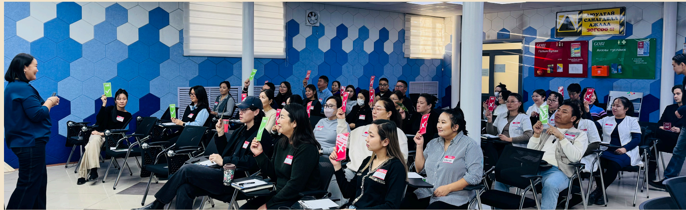
“Аксиом Инк” ХХК-тай хамтран дунд түвшний удирдлагуудад зориулсан “Ажлын байрны ёс зүй ба Шүгэл үлээх системийн ач холбогдол” таниулах сургалт авав.