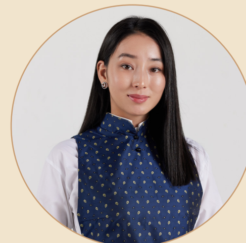
Г. Ган-Эрдэнэ Ёс зүйн хорооны нарийн бичгийн дарга КГ-Комплайнсын ахлах менежер